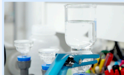
採取した河川水試料のろ過作業の様子