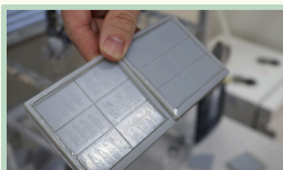
ポリジメチルシロキサン (PDMS) 製のマイクロデバイス