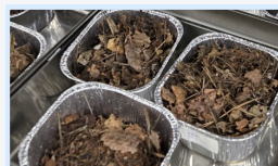
森林で採取した落ち葉試料